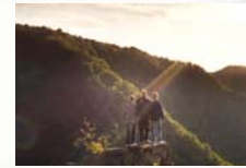
Wenn die Welt uns gehört