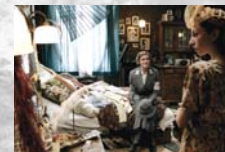
Unsere Mütter, unsere Väter