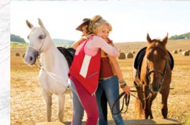
Bibi & Tina – Mädchen gegen Jungs