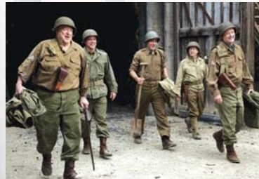
Monuments Men – Ungewöhnliche Helden