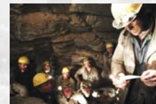
Das Wunder von Lengede