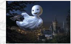
Das kleine Gespenst