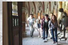
Allein gegen die Zeit – Der Film