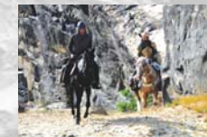
1 ½ Ritter – Auf der Suche nach der hinreißenden Herzelinde