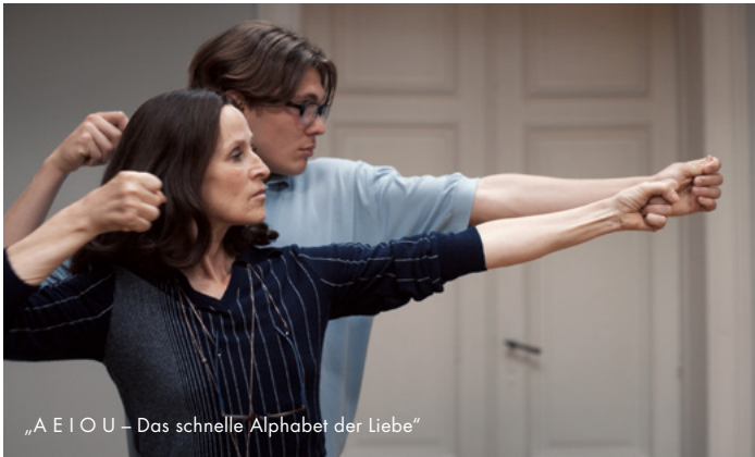
„A E I O U – Das schnelle Alphabet der Liebe“