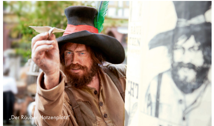
„Der Räuber Hotzenplotz“