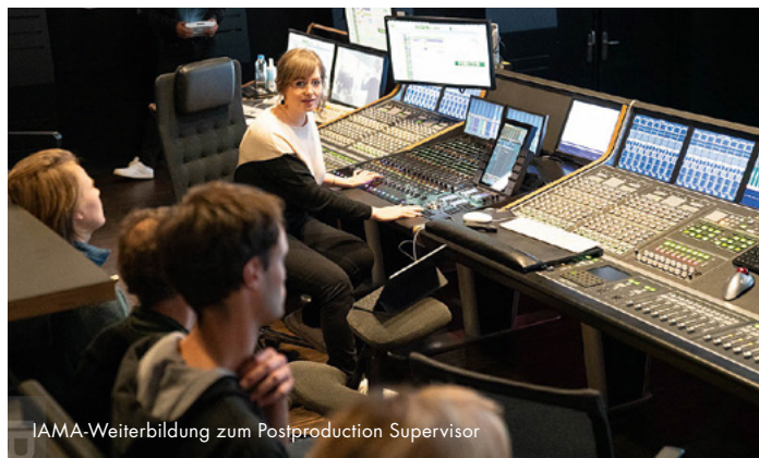
IAMA-Weiterbildung zum Postproduction Supervisor

Antragsteller: Werkleitz Gesellschaft e.V. Fördersumme: 15.000,00 €