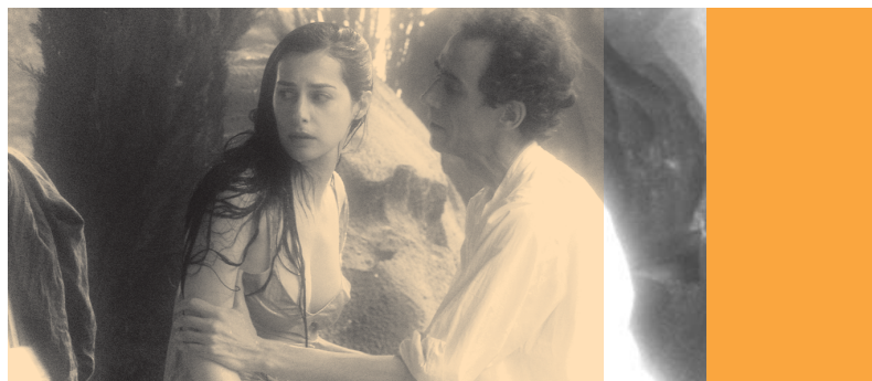
Der Klavierstimmer der Erdbeben