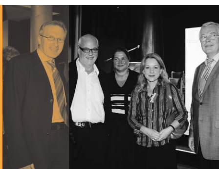
6. Filmkunstmesse Leipzig