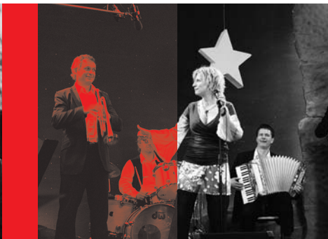
Frei nach Plan