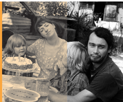
Jahreszeit des Glücks