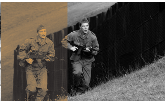
An die Grenze