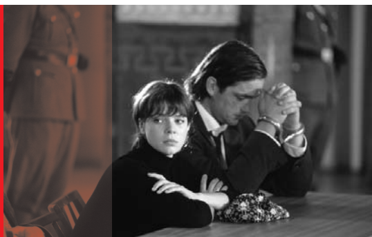
Der Rote Kakadu