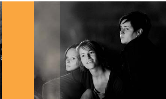
Meer is nich