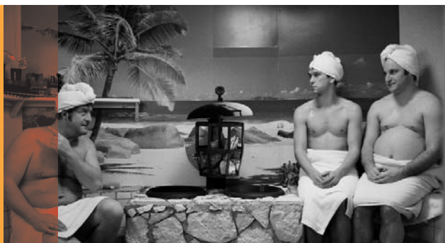
Schröders wunderbare Welt

Waisen wurde und zieht ihn mit einer ehemaligen Prostituierten groß. Er macht den Jungen, gegen alle Vorurteile, zu einem berühmten Arzt und stattet ihn mit einem Kraut gegen sich selbst, den Tod, aus. Doch Daddy Cool verguckt sich in die Pflegemutter, und sein Sohn missbraucht das Kraut – das er nur mit Genehmigung seines Vaters einsetzen darf – um seine todgeweihte Liebe zu retten. Fördersumme: 17.500,00 EUR