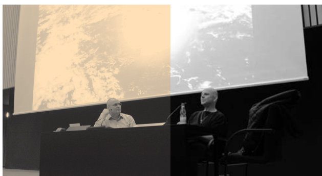
Akademie für Kindermedien

Antragsteller: Stiftung Deutsche Kinemathek Fördersumme: 5.000,00 EUR