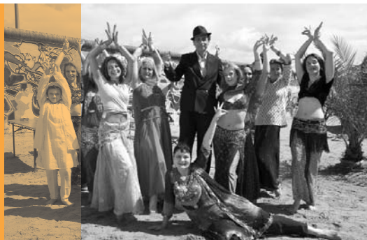
Tailor Made Dreams