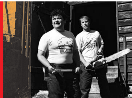
Die Könige der Nutzholzgewinnung