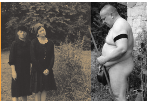
Nimm dir dein Leben