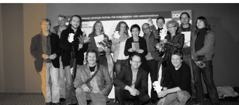
49. Internationales Festival für Dokumentar- und Animationsfilm

Antragsteller: Moonstone International Fördersumme: 170.000,00 EUR