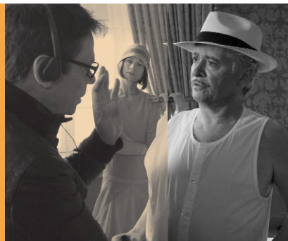
Whisky mit Wodka