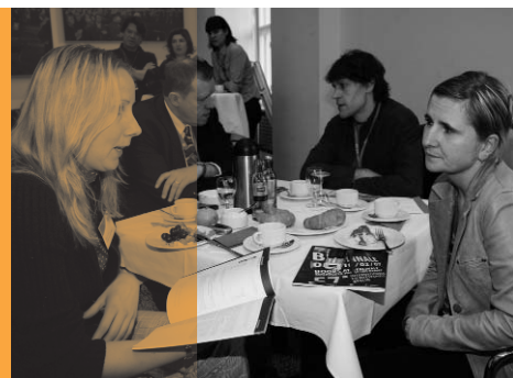
Berlinale Co-Production Market