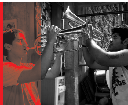
Guča – Distant Trumpet