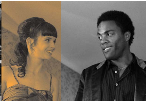
Lulu & Jimi