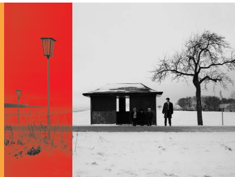
Schröders wunderbare Welt