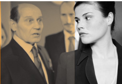
GG19 – Episodenfilm zum Grundgesetz

Genre: Kinderfilm Antragsteller: Gruppe Weimar