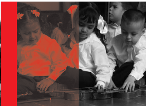
El Sistema – Die Jugendorchesterbewegung in Venezuela