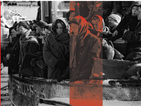
Hafen der Hoffnung – Die letzte Fahrt der Wilhelm Gustloff

Genre: Drama Antragsteller: Mediopolis Film- und Fernsehproduktion GmbH Produzent: Alexander Ris