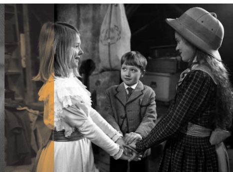
Stella und der Stern des Orients