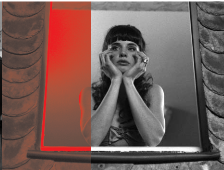
Lulu & Jimi