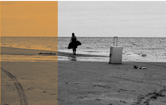
Schläft ein Lied in allen Dingen