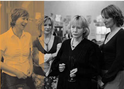
Frei nach Plan

Genre: Drama Antragsteller: ostlicht filmproduktion GbR Produzenten: Uliks Fehmui, Marcel Lenz Autorin: Milena Markovic Regie: Oleg Novkovic Inhalt: Der ehemalige Boxer König, heute ein unberechenbarer und gefährlicher Barbesitzer um die 40 Jahre, lebt in der untergegangenen Bergwerkstadt Bor. Als er auf die 16-jäh-