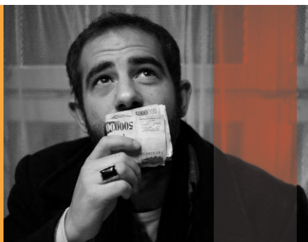
Pazar – Der Markt