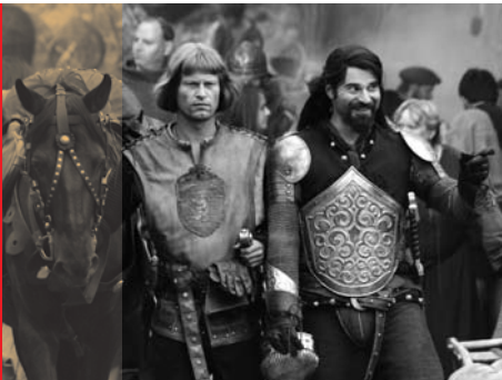
1 ½ Ritter - Auf der Suche nach der hinreißenden Herzeliinde