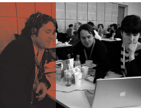
Berlinale Co-Production Market