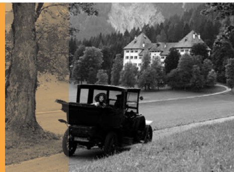
Krupp – Eine Familie zwischen Krieg und Frieden