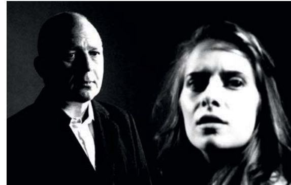
▲ „Hiob“ von Marco Gadge „Hiob“ by Marco Gadge

From April 9 to 12, the Schaubühne Lindenfels theater screened numerous short films for the 11th instalment of the KURZSUECHTIG short film festival, for which more than 100 entries had been submitted. The screenings of selected animated films, documentaries, and fictional films each took up a whole evening. After the screenings, the jury and the audience each picked their winners. In the animation segment, „Darling“ by Izabela Plucinska (jury pick) and „Essen – Stück mit Ausblick“ by Peter Böving (audience pick) took the prizes. Besides, the jury gave an honorable mention to „Many a Time“ by Andreas Hell. The emerging talent award of Sächsischer Filmverband went to „Daphne“ by Laura Nuñez. The winners in the documentary segment were: „Rotation“ by Ginan Seidl and Clara Wieck (jury pick) and „Neununddreißig“ by Patrick Richter and Jessy Asmus (audience pick). In the Fiction category, „Hiob“ by Marco Gadge (jury pick) and „Sunny“ by Barbara Ott (audience pick) won the awards. The competition for musical scores and sound design, held on Saturday, April 12, was also very well received. On the final night of the festival, all the winning films were once more screened in the largest theater of the Schaubühne venue. They will also screen at Kinobar Prager Frühling on June 11.