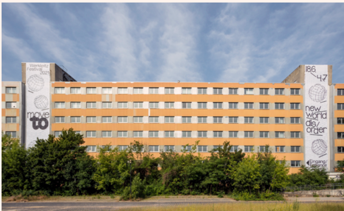
ehemalige Stasizentrale in Halle (Saale) rechts: „Kissing Data Symphony“, „Vibrations Prototype“