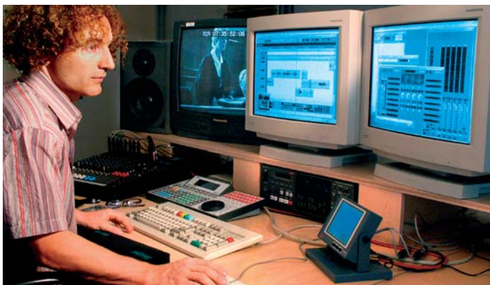
Demnächst in Leipzig: Steinbergs State-of-the Art DAW in der neuesten Version.