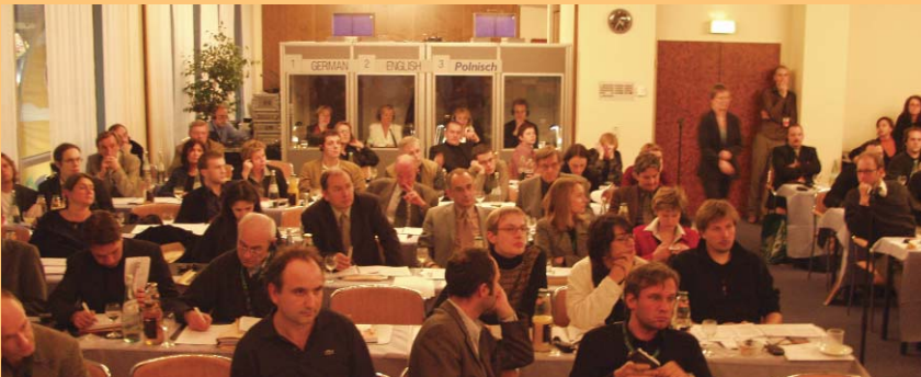
Connectig Cottbus 2002

Websites sowie deren Entwicklungen in der europäischen Gesetzgebung statt. Außerdem werden Fallstudien von den Teilnehmern und Experten erläutert. Der Workshop gehört zu einer Reihe von Kursen des Erich-Pommer-Instituts, die grundlegende und weiterführende Kenntnisse aus dem Bereich Medienrecht und Medienfinanzierung vermitteln. Anmeldung: sofort, Teilnahmegebühren: 875,00 EUR (inkl. Anmeldung, Kursmaterialien und Unterkunft)