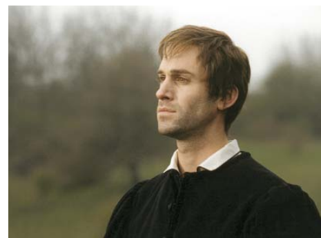
v.o.n.u.: Das Bernsteinamulett, Fiasko, Luther