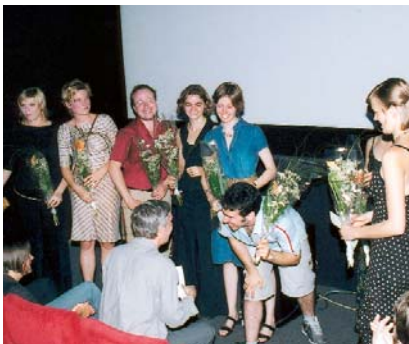
Abschlussmeeting European Animation Masterclass 2003