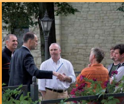
Fotos links: »Red like the sky« Leadership Master Class (LMC) 2007 Foto rechts: backup_festival