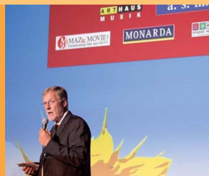
Staatsminister Rainer Robra

sche Bearbeitung, Produktveredelung auf DVD bis hin zum Weltvertrieb abzudecken. Dabei sollen ein durch kurze Wege gewährleitetes effektives Zusammenarbeiten sowie vielfältige Synergieeffekte Komplettdienstleistungen praktisch aus einer Hand ermöglichen. Es entstand ein echtes »Flair for Entertainment«, ein wunderbarer Rahmen für Kreativität und Kompetenz, der länderübergreifend agieren möchte. In seinem Grußwort erinnerte Staatsminister Rainer Robra an die Geschichte des Hallenser Medienhauses seit der Eröffnung des Gebäudes: »Gebaut 1863 als Lokal- und Gesellschaftshaus und genutzt als Festsaal und Tanzschule der Stadt Halle wurde der Saal Anfang des 20. Jahrhunderts zunächst in einen Theatersaal, dann in ein Varieté verwandelt und später als Kinosaal (Ring-Theater) mit zeitweilig bis zu 500 Sitzplätzen genutzt. Diese Nutzung als Kino war die bis heute längste einheitliche Nutzung bis Anfang der 60er Jahre. Nach Schließung des Kinos zog dann 1964 der Deutsche Fernsehfunks mit dem Fernsehstudio Halle ein. Von 1992 bis zur Eröffnung seiner Hörfunkzentrale 1999