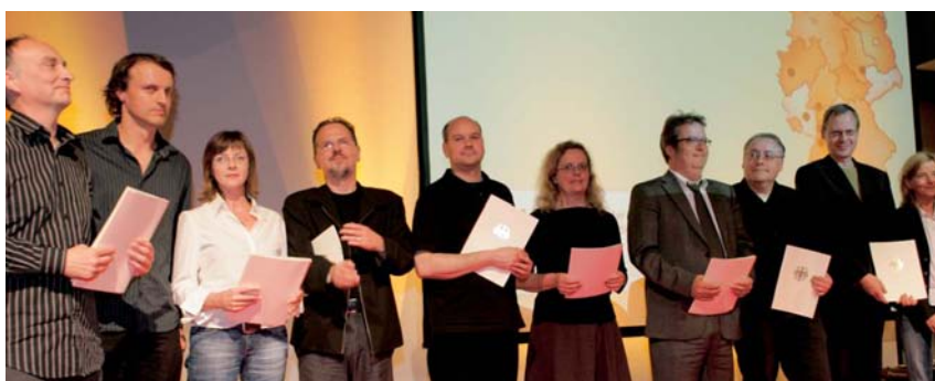
Foto oben: Der Beauftragte der Bundesregierung für Kultur und Medien, Bernd Neumann, überreicht die Kinoprogramm- und Verleiherpreise 2007 Foto links: Die Gewinner des Preises von 10.000 EUR

Kino+Bar« (Halle), »Lux Puschokino« (Halle), »Lux Kino am Zoo« (Halle), »Passage Kinos« (Leipzig), »Kinobar Prager Frühling« (Leipzig), »Cineding« (Leipzig), »Studiokino« (Magdeburg) sowie das »Lichthaus« (Weimar).