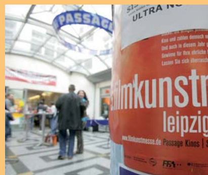
Blick in die Passage-Kinos