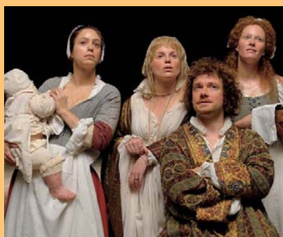
»It's a Free World« »Nightwatching«