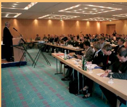
Thüringer Mediensymposium 2004