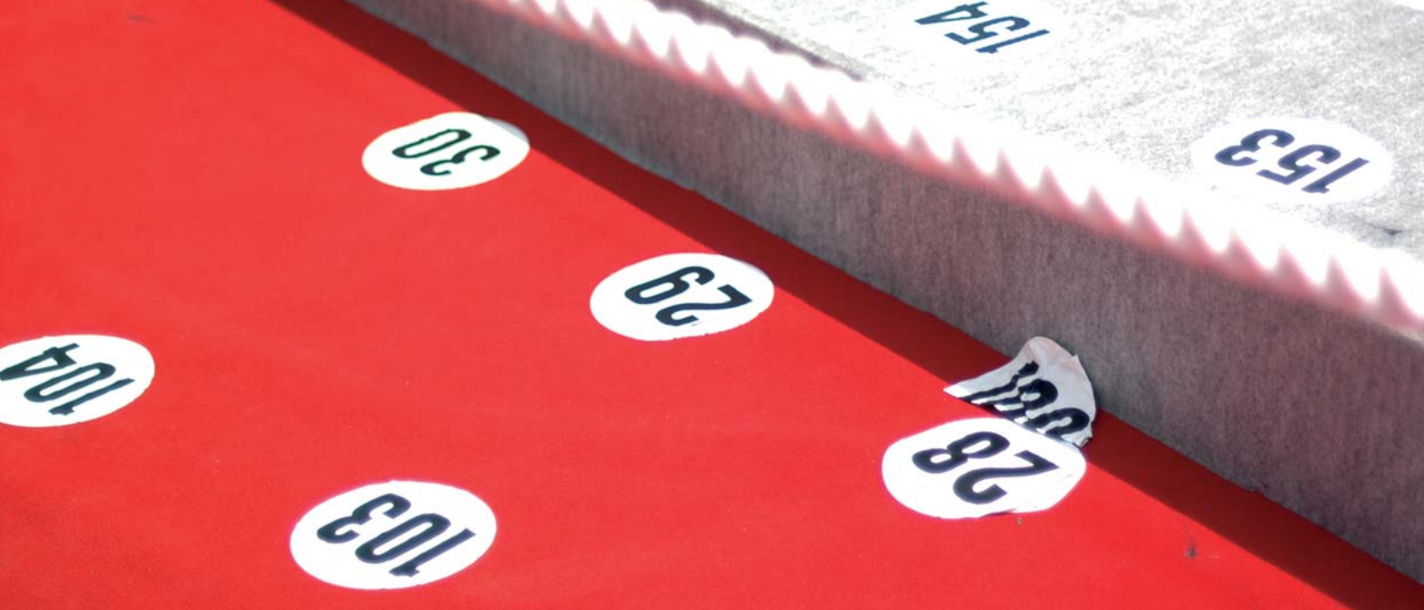
Foto left: Wigbert Moschall (center) Foto page 7 top: Conversation Foto page 7 bottom: Set "Schultze gets the Blues"

too late to make a move regarding global distribution. Apparently it was a different story with "Schultze gets the Blues" by Michael Schorr.