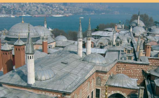
»Mätressen – Die geheime Macht der Frauen«