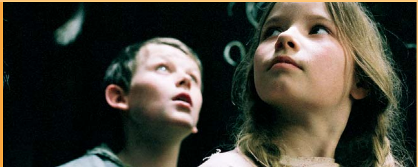
Foto links: »Stella und der Stern des Orients« Foto rechts: »Hänsel und Gretel«

The forest theme plays an important part in many fairytales and folk tales. The shooting for "Stella und der Stern des Orients" and the most recent adaptation of the Grimm's fairytale "Hans and Gretel" took place in the depth of the Thuringian forest in the spring of 2005.