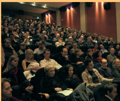
MDM Jahresabschluss 2004