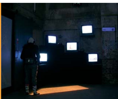
Lab Screens von Undine Siepker

Das backup_festival in Weimar, 1999 im Kulturhauptstadtjahr gestartet hat mittlerweile eine Größe erreicht, welche ihm einen respektablen Platz innerhalb der europäischen Festivals einräumt. Ziel des Festivals, das in diesem Jahr vom 06. bis 09.10.05 im Weimarer E-Werk stattfindet, ist eine Untersuchung der Einflüsse der Neuen Medien auf Inhalt, Erzählweise, Ästhetik, Produktion, Präsentationsform und Vertrieb medialer Arbeiten.