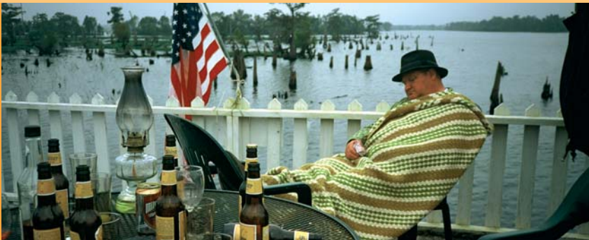
»Schultze get's the blues«