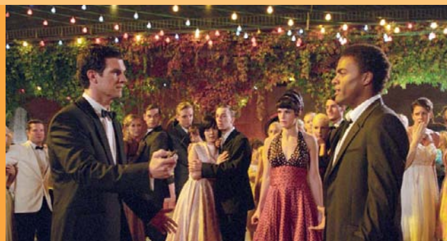
»10 Sekunden« »Lulu & Jimi«

Autoren: Gordian Maugg, Alexander Häusser Regie: Gordian Maugg Inhalt: Der Winter 1946/47 war einer der kältesten des vergangenen Jahrhunderts. Hunderttausende fielen im kriegszerstörten Europa Nahrungsmangel, Kälte und Krankheiten zum Opfer. So auch in Deutschland. Das Dokudrama erzählt die Geschichte des Überlebenskampfes anhand mehrerer Familien in Deutschland. Fördersumme: 180.000,00 EUR