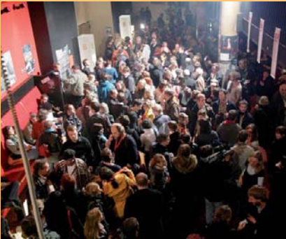
Besucher der »nacht des jungen films«, DOK Leipzig 2007