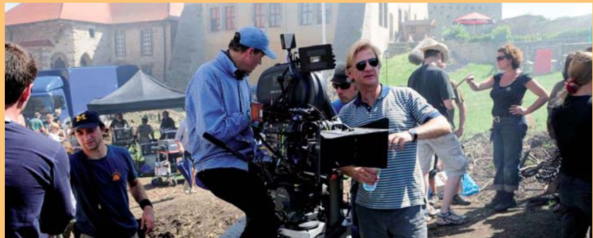
Söhnke Wortmann am Set »Die Päpstin«

lich bleibt die richtige Besetzung in diesem Fall eine besondere Gratwanderung. Denn trotz aller Verkleidung muss der Zuschauer mit ihm/ihr mitfühlen.