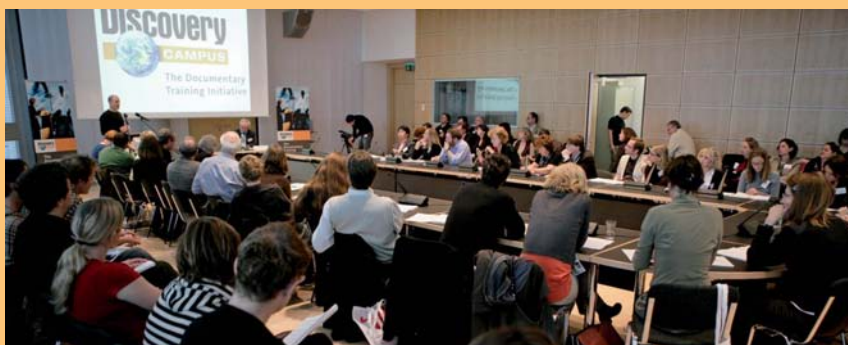
Foto links: Abschlusspitching der Discovery Campus Masterschool auf dem DOK Leipzig Festival 2007